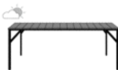
TABLE DE REPAS