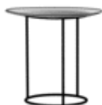
TABLE D'APPOINT PLATEAU CONCAVE